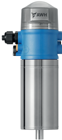
VMove 0 mit VMON II Steuerkopf