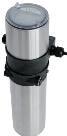
VMove 1 с позиционером Bürkert 8692