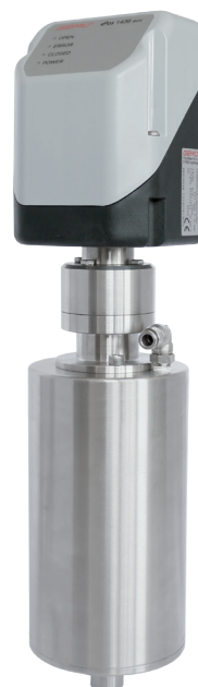
VMove 1 с позиционером Getü 1436 Eco