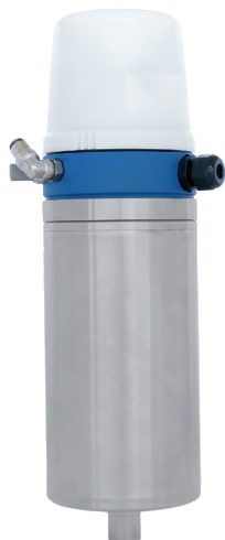
VMove 1 с управляющей головкой VMon